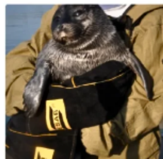
Поддержка и опора