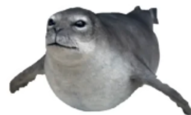
Что-то на тьюторском