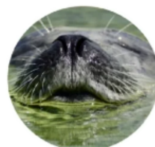
Масштабирование в глубину