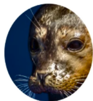
Тьютор – не психолог