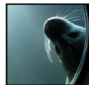
можем подумать друг об друга